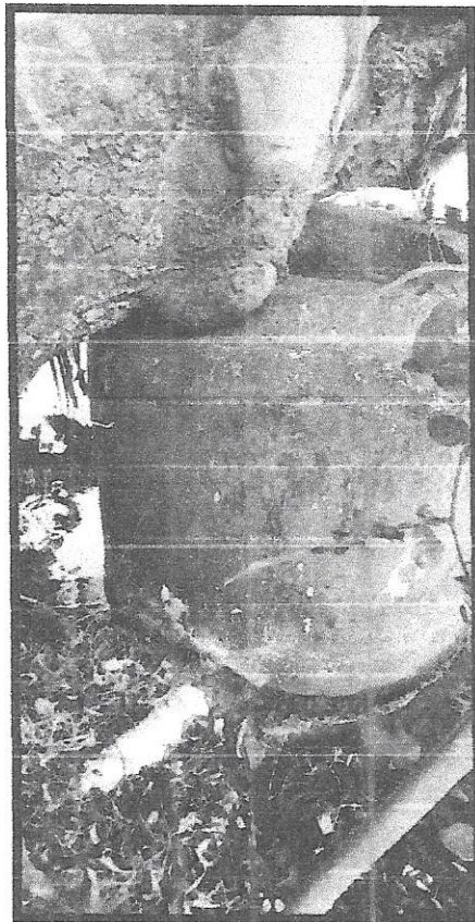
Foto 2. Acercamiento al árbol y al drenaje, se puede observar el deterioro que presenta el drenaje.